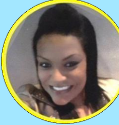
H (HOTEL) SCORPIO